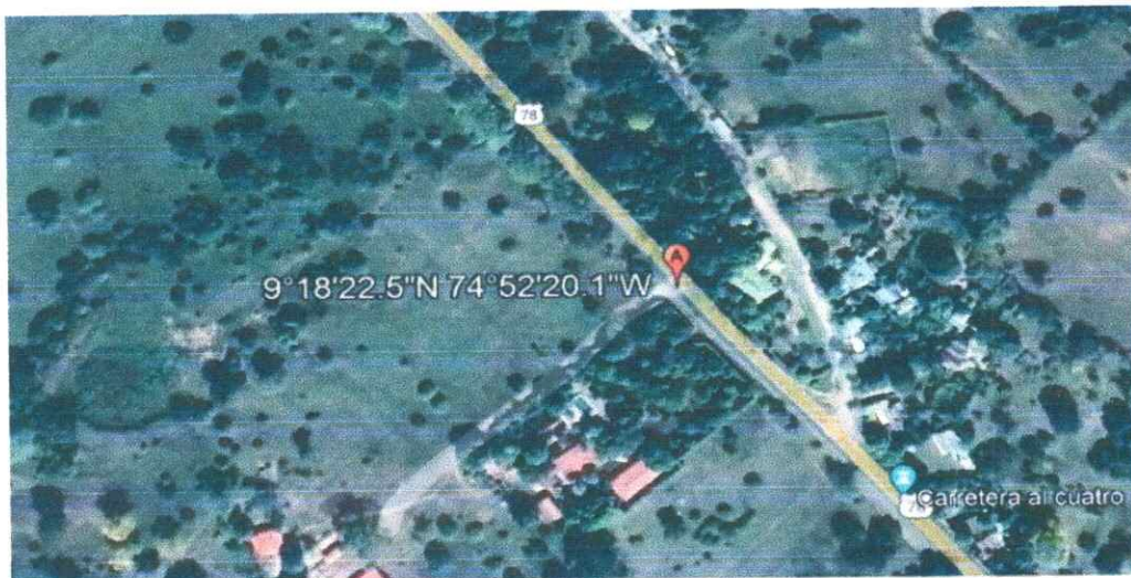
Figura 1. Google Earth -Localización.